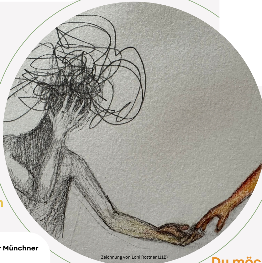
Zeichnung von Loni Rottner (11B)

Mo 14-16 Uhr, Mi 14-18 Uhr, Do 10-12 Uhr