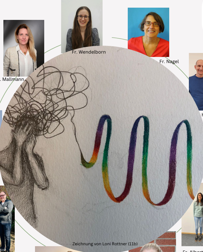
Zeichnung von Loni Rottner (11b)