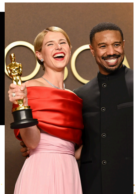
Michael B. Jordan und Jessie Buckley 6